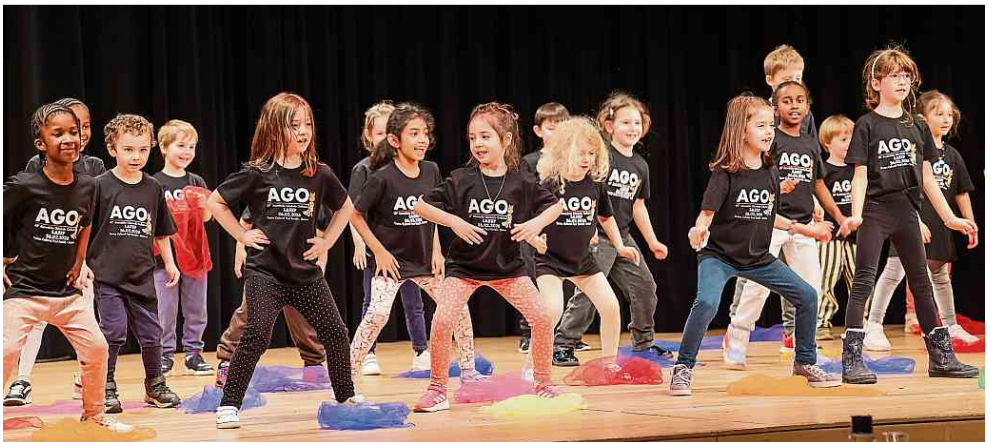
Die Kinder der lokalen LASEP-Sektion aus Strassen wissen, wie wichtig Bewegung im jungen Alter ist.

lieren können – sie haben das nie gelernt. Befinden sich solche Kinder in einer Gruppe, wird es schwierig, ordentlich zu unterrichten. Noch schlimmer sind Streit und körperliche Auseinandersetzungen. Dann muss die