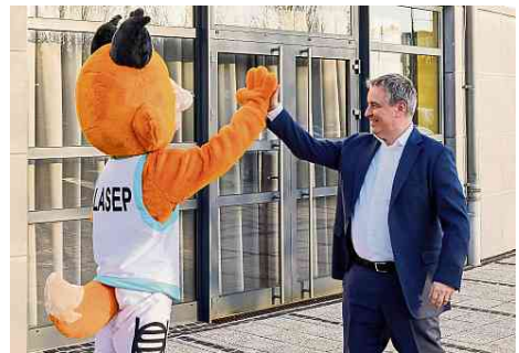
Das LASEP-Maskottchen Sporty begrüßt Bildungsminister Claude Meisch.

müsste vielleicht einmal hinhören und nach unseren Bedürfnissen fragen. Auf Nachrichten bei der INAPS (Institut national de l'activité physique et des sports), hieß es, man spreche zunächst mit den großen Verbänden und beziehe dann schrittweise alle anderen ein. Ich erinnere daran, dass wir als dem COSL angehörende Föderation rund 10.000 Kinder betreffen. Das können nur wenige andere Verbände von sich behaupten.“