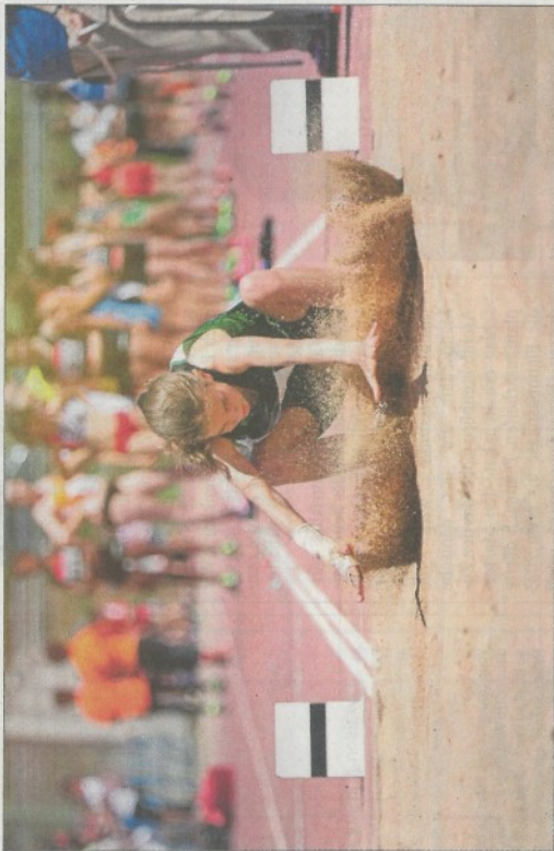
Die Lasep will nicht in Konkurrenz zu den Sportvereinen treten. Ziel ist es vielmehr, als Sprungbrett für den Eintritt in einen solchen zu dienen.

Autoverkauf. Genehmigt wurde ebenfalls der Verkauf eines alten Autos an einen Gemeindearbeiter. Der Verkaufspreis liegt bei 300 Euro.