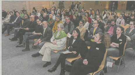
Zahlreiche Ehrengäste, darunter auch drei Gastredner, wohnten der Präsentation der App am Freitagnachmittag bei.

len. Von einer Tages- über einer Wochen- bis zu einer Jahreschallenge sind alle Varianten möglich. Die Tätigkeiten können sowohl per Klasse, per Stufe oder gar für die gesamte Schule erstellt werden. Belohnt werden die Teilnehmer mit Punkten, aber auch mit besonderen Preisen, etwa die Kostenübernahme beim jährlichen Sportausflug.